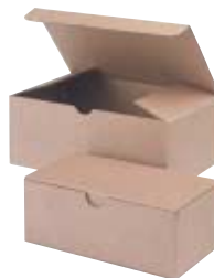
SCATOLETTA in cartone per catena in matasse

BOX for chain in long length (28 x 19,5 cm - h 16,5 cm)