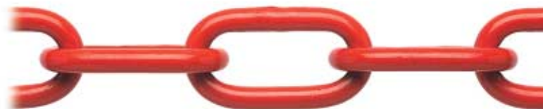
VERNICIATA* - PAINTED*