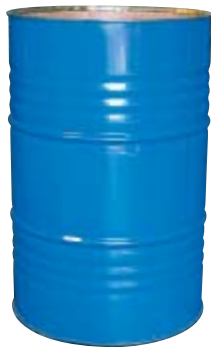
FUSTO in ferro da 200 litri (Ø 60 cm - h 90 cm)

DRUM in iron, 200 liters capacity (Ø 60 cm - h 90 cm)