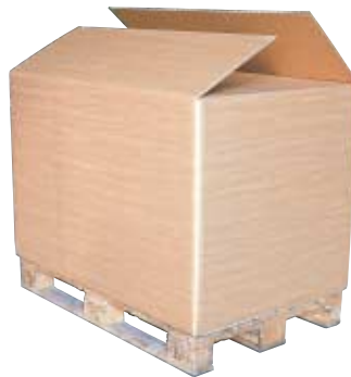
CARTONBOX (120 x 80 cm - h 86 cm)

DRUM in iron, 200 liters capacity (Ø 60 cm - h 90 cm)