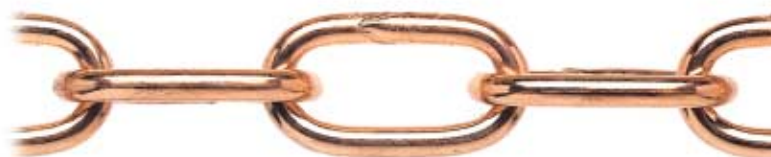
RAMATA - COPPER-PLATED