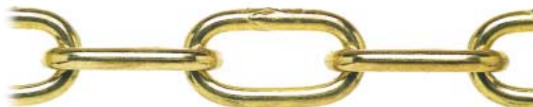
OTTONATA - BRASS-PLATED