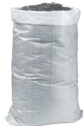
SACCO in raffia