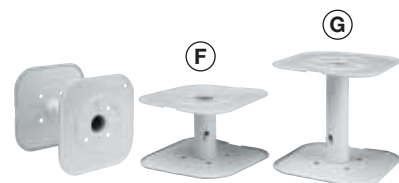
BOBINA in metallo tipo F e G

(Ø external 15 cm - Ø internal 3 cm total length 15,6 cm)