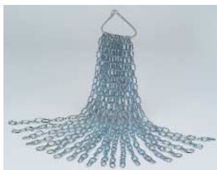
SPEZZONE in matassa CUT SIZES in bundle