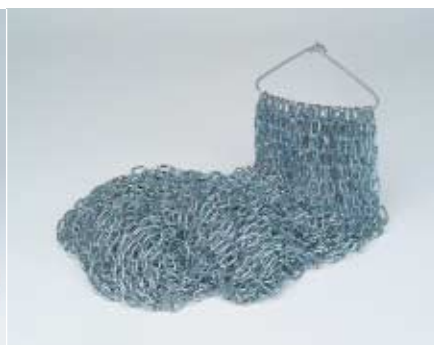
MATASSA 1 legame BUNDLE 1 bond