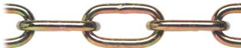
TROPICALIZZATA - YELLOW GALVANIZED