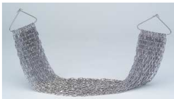
MATASSA 2 legami - BUNDLE 2 bonds