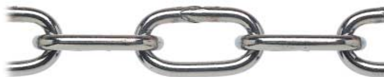
LUCIDA - POLISH