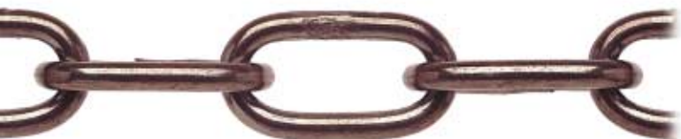
BRONZATA - BRONZE-PLATED