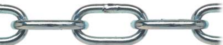
ZINCATA - ZINC-PLATED