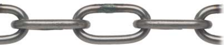
GREZZA - SELF COLOURED