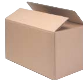
SCATOLA in cartone per catena in bobine