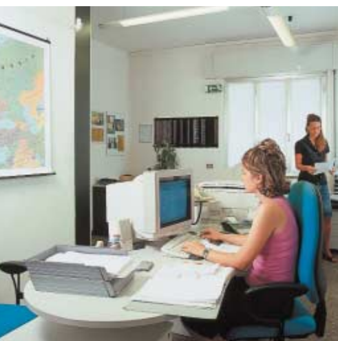
Area Commerciale-Amministrativa Commercial and Amministrative area