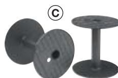
BOBINA in plastica tipo C

(Ø external 20 cm - Ø internal 3 cm total length 10 cm)