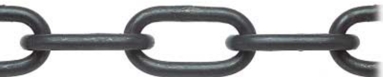
BRUNITA - BURNISHED