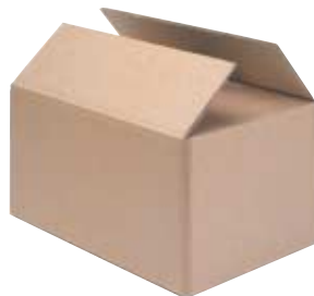
SCATOLA in cartone per catena in filo continuo

BOX for chain in spools (22 x 37 cm - h 22 cm)