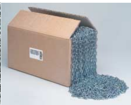
FILO CONTINUO in scatola LONG LENGTH in box