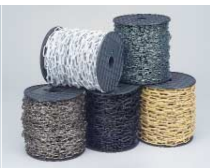
BOBINA - SPOOL