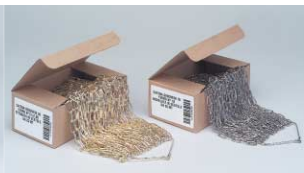
MATASSA in scatola - BUNDLE in box