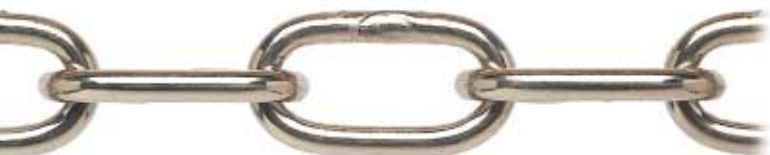
NICHELATA - NICKEL-PLATED