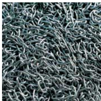
FILO CONTINUO LONG LENGTH