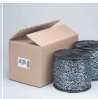
BOBINA in scatola SPOOL in box